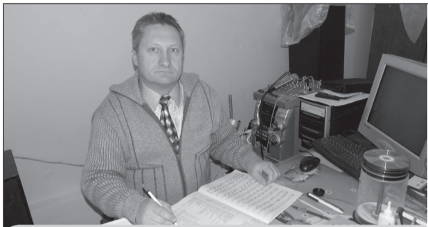
ТВОРИ ТОЛЬКО ДОБРЫЕ ДЕЛА