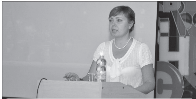
ТРЕХМЕРНОЕ МОДЕЛИРОВАНИЕ С CAD/CAM